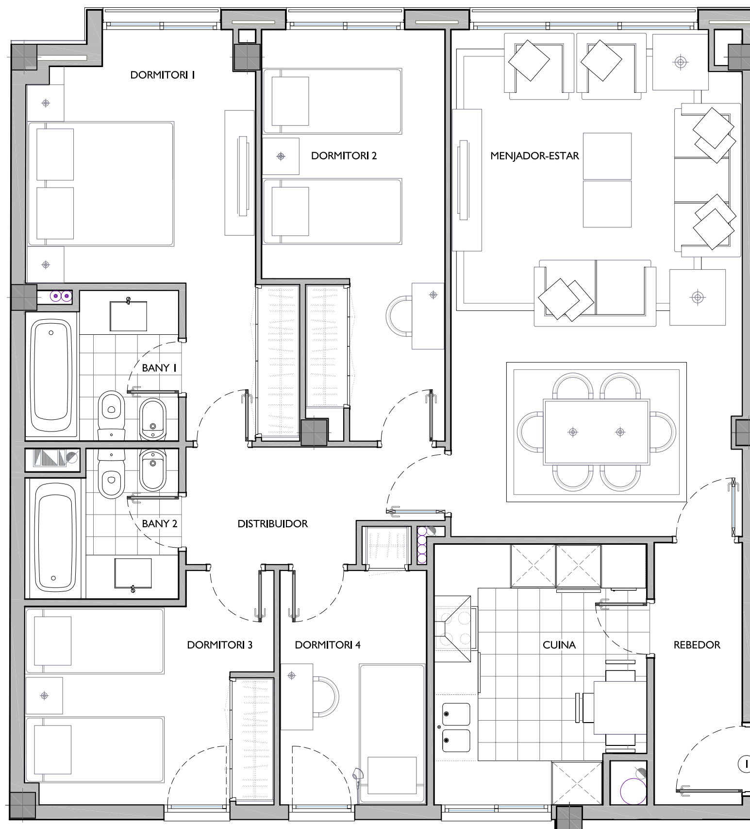
ESCALA 2 PLANTA CINQUENA - PORTA 1ª