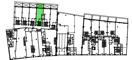
CARRER ESTEVE TERRADES