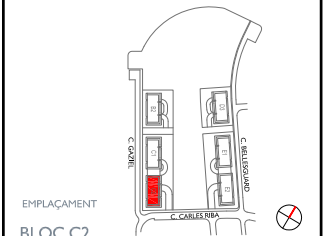
EMPLAÇAMENT BLOC C2 ESCALA A PLANTA PRIMERA - PORTA 2ª